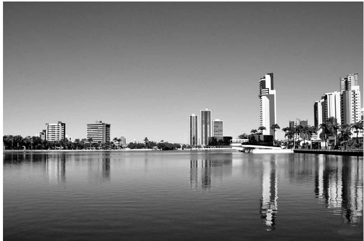
Açude Velho, que até o início do século XX abastecia a população, recebe esgotos sem tratamento e está bastante assoreado

A falta de saneamento básico é outro problema que ainda afeta centenas de moradores de bairros da periferia, aonde os benefícios da urbanização ainda não chegaram à sua plenitude. Moradores de uma área localizada nas proximidades do Residencial Major Veneziano, no bairro de Três Irmãs, zona sudoeste, reclamam de uma lagoa formada por dejetos. As águas dessa lagoa aumentam de volume a cada chuva registrada em Campina Grande, ameaçando inundar casas próximas e dificultando o trânsito