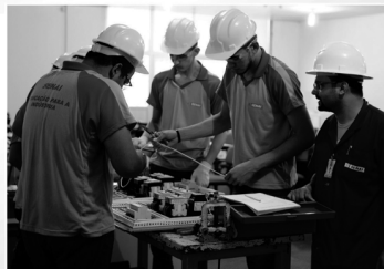
Aluno SENAI tem excelente aceitação no mercado de trabalho. Venha para o SENAI

As vagas em Campina Grande estão sendo ofertadas para os cursos de Técnico em Administração, Técnico em Calçados, Confeccionador de Calçados, Impressor OFFSET, Mecânico de Usinagem, Assistente de Gerenciamento de Obras. Na Capital existe disponibilidade para os cursos gratuitos de Técnico em Mecânica, Costureiro à Máquina na Confeção em Série, Assistente Administrativo, Impressor OFFSET, e em Bayeux, Assistente de Gerenciamento de Obras. As inscrições podem ser realizadas por meio do endereço eletrônico www.fiepb.com.br/senai . Para maiores esclarecimentos os interessados devem entrar em contato pelos números: (83) 2101 5366 (Campina Grande) e 3241 6570 (João Pessoa).