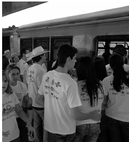
Turistas ocupam sete vagões do trem, todos animados por um trio de forró

São João do Carneirinho Memorial Severino Cabral, na Avenida Getúlio Vargas, Centro.