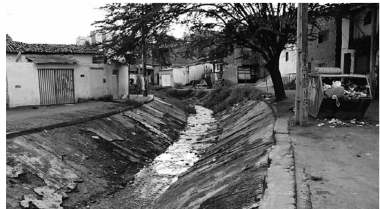
Em bairros da periferia da cidade, moradores reclamam dos dejetos e dos canais de esgotos