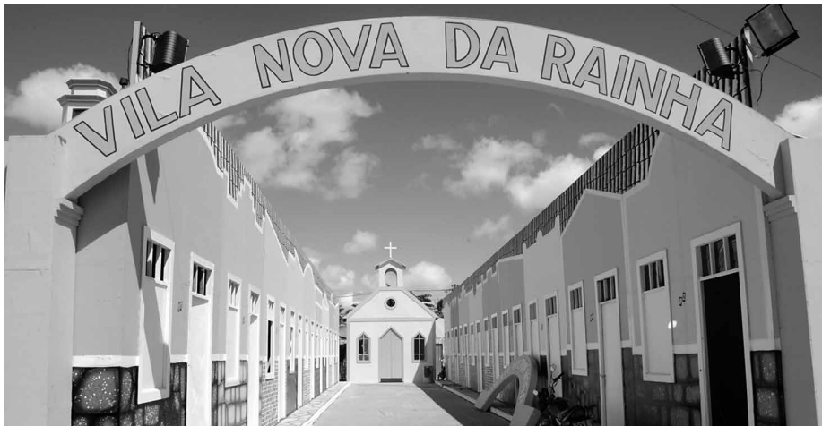
Cidade cenográfica Vila Nova da Rainha, instalada no Parque do Povo, se transformou em uma das atrações mais visitadas do São João de Campina Grande