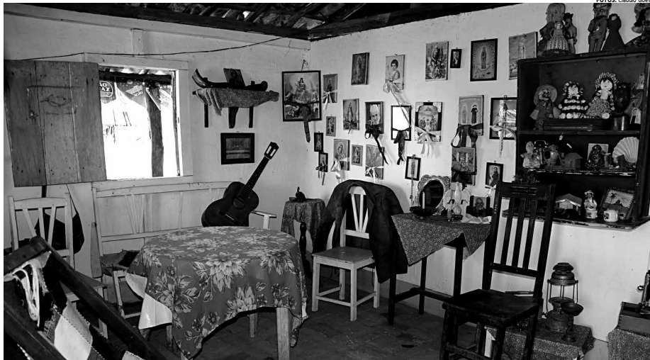
Sala com mobiliário e decoração tipicamente nordestinas faz parte do Sítio São João, que está aberto à visitação até dia 3 de julho, das 11h às 22h, no bairro do Catolé

Haverá ainda a estreia de um trabalho desenvolvido pelo Memorial Severino Cabral, em que bonecos de tamanho real foram confeccionados com materiais recicláveis, entre outras atrações típicas dos festejos do Maior São João do Mundo.