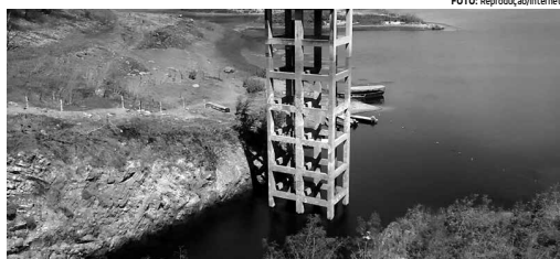
Possibilidade de colapso de abastecimento do Açude de Boqueirão foi tema de discussões