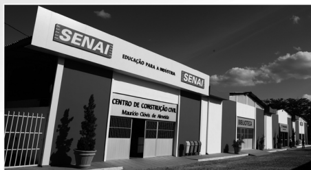
Centro de Construção Civil Maurício Clóvis de Almeida, Unidade do SENAI/PB, referência na formação de mão de obra para a Construção Civil

A Organização das Nações Unidas (ONU) apontou o Serviço Nacional de Aprendizagem Industrial (SENAI) como uma das três mais importantes instituições para alcance do objetivo de assegurar educação de qualidade entre os integrantes da Cooperação Sul-Sul — mecanismo de países emergentes do hemisfério destinado a dar respostas conjuntas a desafios comuns. O trabalho desenvolvido pelo SENAI é citado na publicação Boas Práticas em Cooperação Sul-Sul e Triangular para o Desenvolvimento Sustentável, lançada, na semana passada, pelo Escritório das Nações Unidas para a Cooperação Sul-Sul. A publicação destaca o compromisso do SENAI com a oferta de cursos de qualidade em 28 áreas tecnológicas, de forma presencial e a distância, alinhada com as necessidades da indústria. O documento cita, entre outros, o programa SENAI de Tecnologias Educacionais, que investiu no desenvolvimento de aplicativos para smartphones e tablets destinados a seus alunos, como exemplo do comprometimento da instituição com novas práticas pedagógicas.